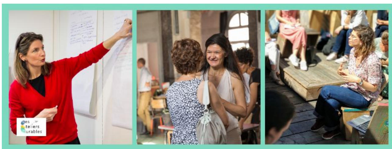
Exemples d'interventions réalisées en entreprise par notre collectif lors de semaines de qualité de vie au travail

Inscrivez les objectifs QVT dans le fonctionnement quotidien de votre entreprise et mettez en places les actions, formations, outils adéquates pour atteindre vos objectifs. Cela peut passer par des espaces de discussion, de nouvelles méthodes à mettre en place, l'organisation d'une semaine de la QVT avec des ateliers et formations sur mesure (on vous partage ici tous nos tips pour l'organiser ! ), etc. Puis, faites un bilan des actions mises en places et identifiez les succès et problématiques restantes.